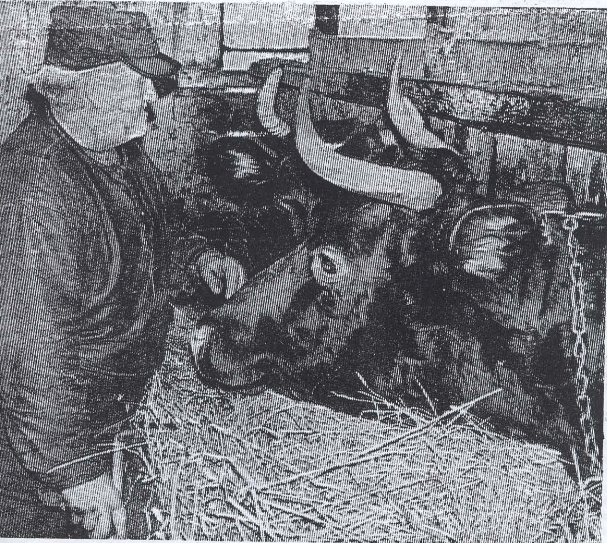
Korna är för de Mander inte bara osjäliga djur, de är hans vänner och sällskap. Trots de vän- skande benen tar han sig till ladugården tre gånger om dagen. "Kokräka ska väl inte straffas för att mina gamla skänker ä tokiga" säger han.